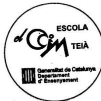
Aurora Perea Borràs